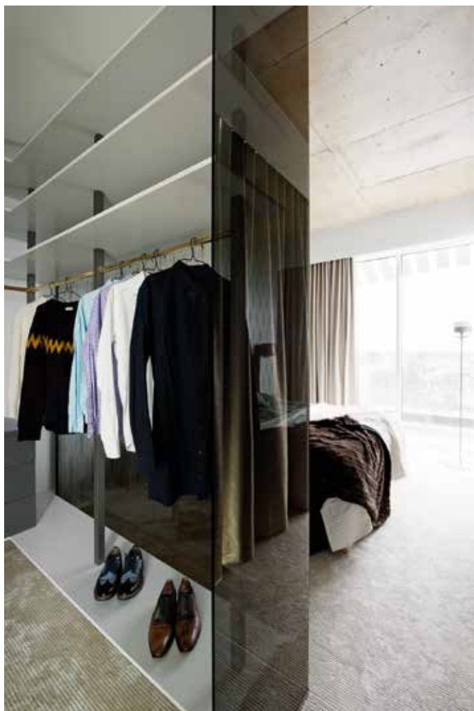
Avatud klaasist garderoob nõuab distsipliini.