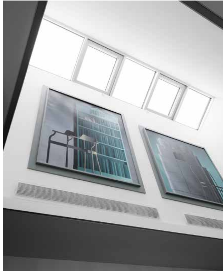
Arhitektuurne ruum ja arhitektuurne kunst.

maja ise ehk selle eriline arhitektuur. «Et modernsesse linnamajja ei tuleks Jahipauna meenutav kodu, lisasime glamuuri alati šikilt mõjuva halli ja messinguga.»