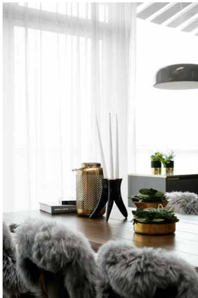
Detailid viitavad loodusele.