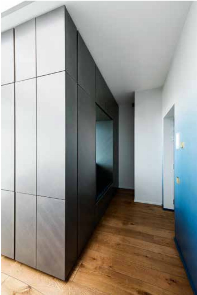
Esikusse langeb valgus läbi kapiplokis oleva siseakna.