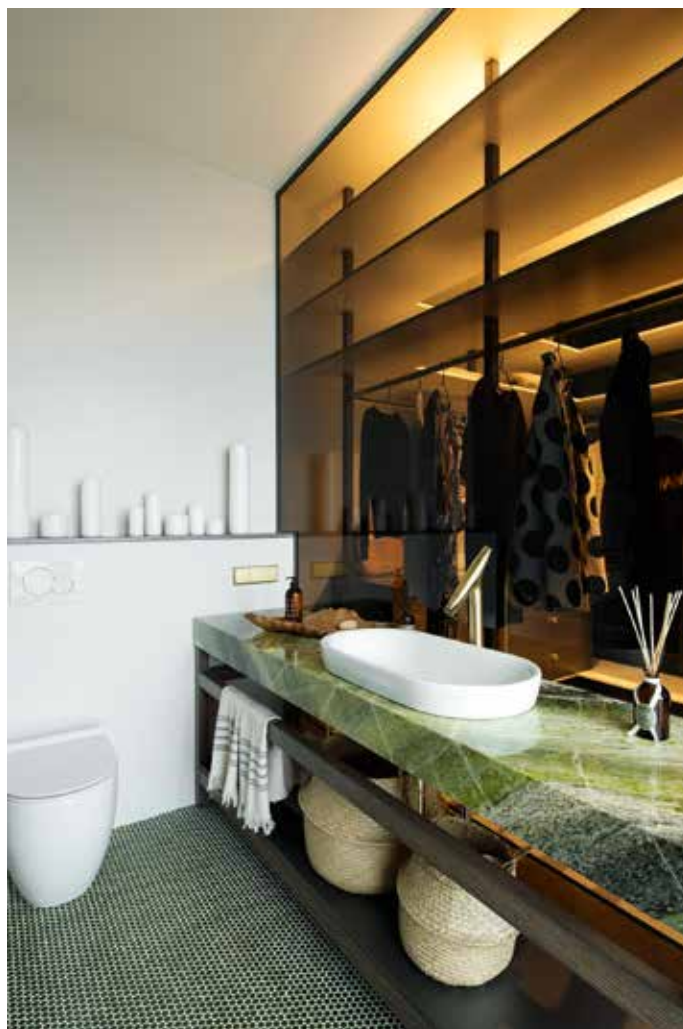
Efektsed materjalid ja loodustoonid täies ilus.