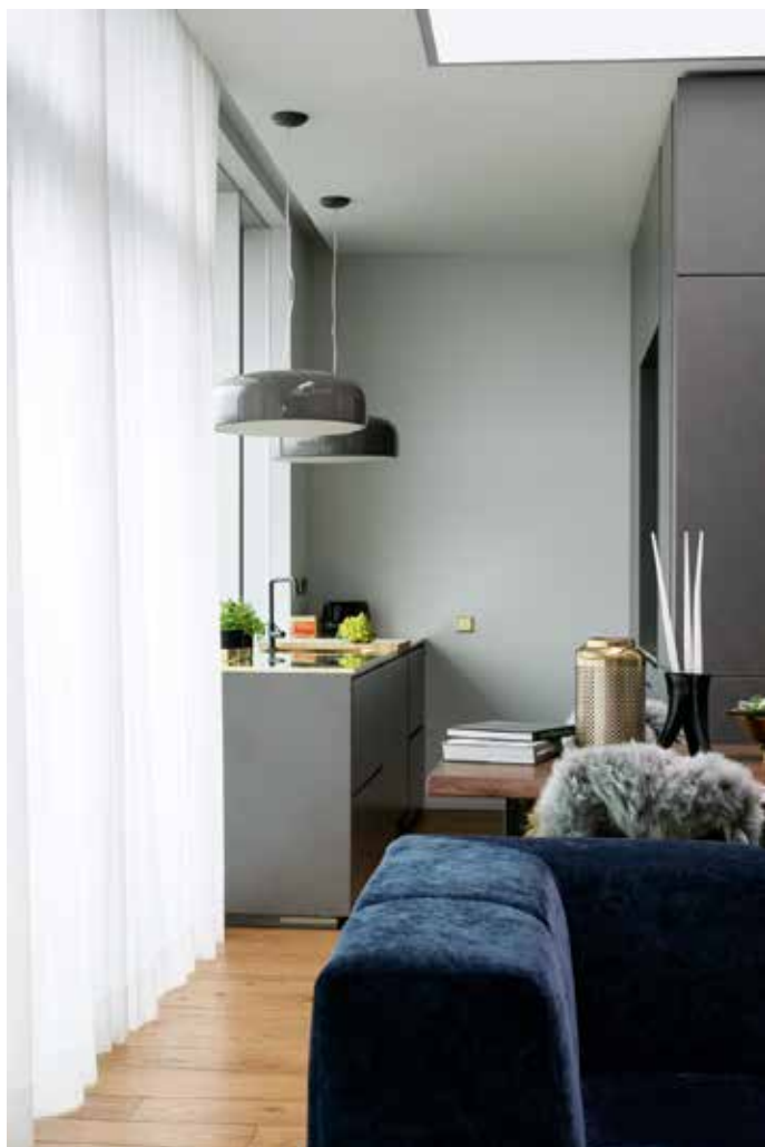
Köögis ripuvad Flosi valgustid Smithfield.