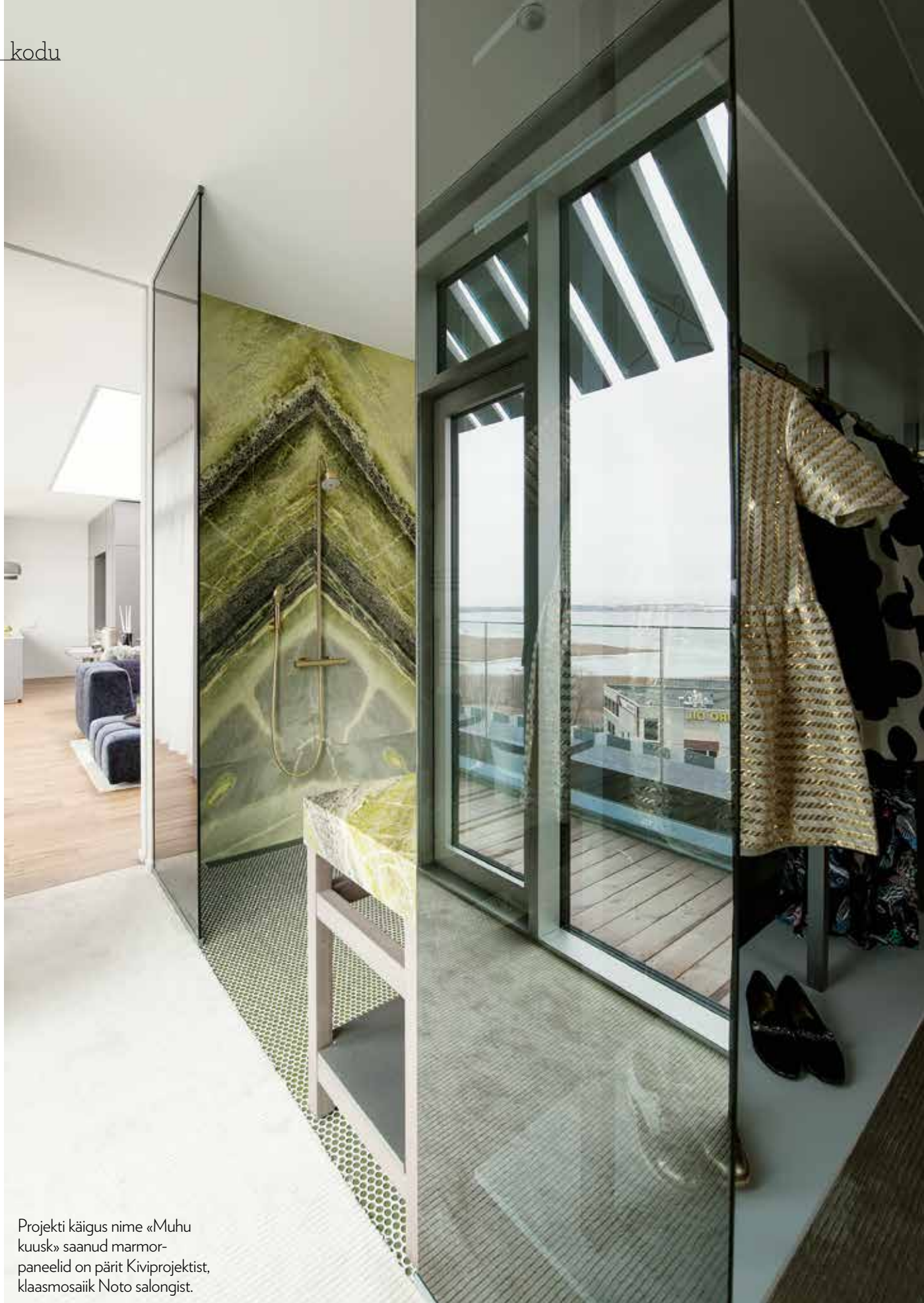
Projekti käigus nime «Muhu kuusk» saanud marmor-paneelid on pärit Kiviprojektist, klaasmosaiik Noto salongist.