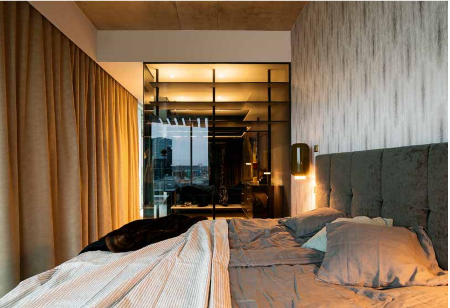
Rikkalikud tekstiilid ja mahe valgus toovad magamistuppa soovitud õdususe.